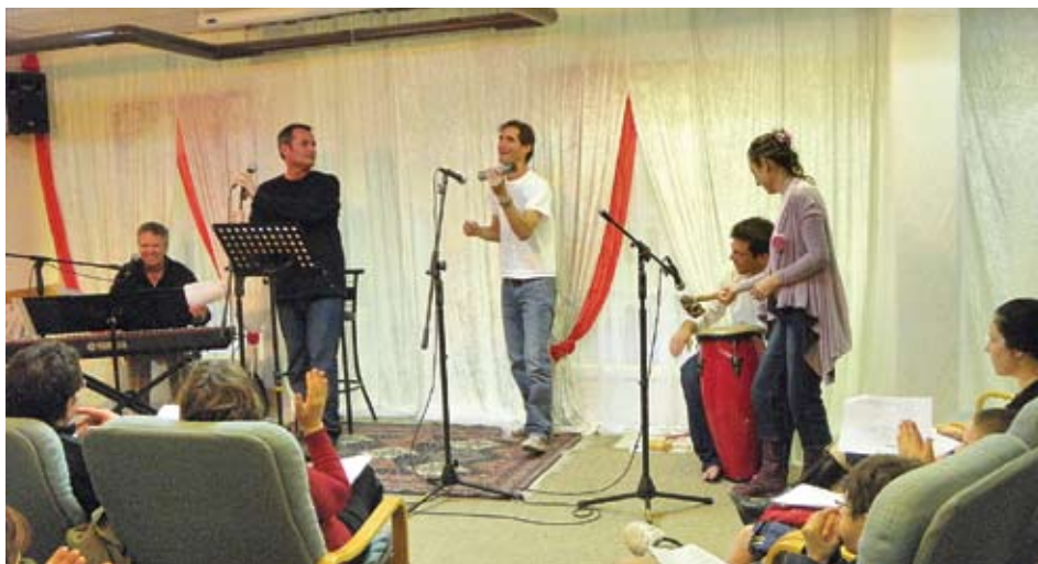
"שינויי מזג האוויר" במועדון לחבר ביטבתה.