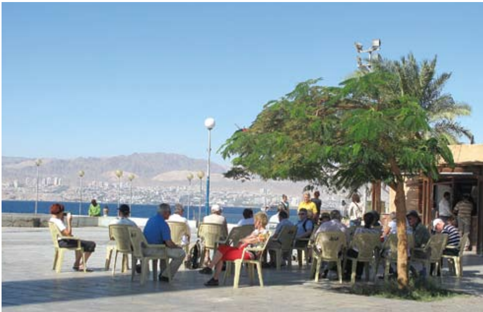
תיירים מגרמניה ליד הקיוסק היחיד ברחבת הדגל. ברקע: אילת

ירדן", מחייך עאוודה. יש גם בתים זולים יותר במחיר של 100 עד 300 אלף ש"ח. מר-כזי קניות גדולים, בינוניים וגם קטנים יותר כבר קיימים בעקבה, ועוד כמה גדולים ומודרניים נמצאים בהקמה. המחירים גבוהים יותר מאשר בעיר, אבל עדיין כ-20% פחות מהמחירים שלנו. אחד הקניונים אפילו מופעל על ידי הקבלן נופי מאילת, השוכר אותו מהבעלים הירדני.