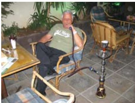
כתבנו מתרגע בסוף יום עמוס

תעשייה פטור ממכס, הנהנה מכל היתרונות וחבילת ההטבות המלכותית ויש בו אפילו מפעל ישראלי לצנרת, שהועתק לכאן מבאר שבע. בינות ההרים נבנית שכונת מגורים ענקית המיועדת לעובדי המלונות והפרויקטים AYLA ו-SARAYA. עאוודה התעיף. חוזרים לעיר למנוחה. מלון אקווה מרינה, בבעלות המיליונר הלבנוני ח'ורי, נקבע כבסיס הלי-לי שלי - 45 דינרים כולל ארוחת בוקר. 230 ש"ח. 4 כוכבים שכבר נראים קצת דהויים.