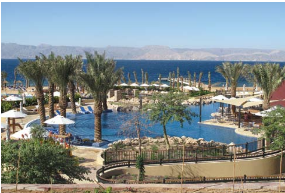
נוף הנשקף מבית הקפה במלון מובנפיק דרום.

בצד הדרך חולפים על פני שכונת מגורים. "כאן גרים בעיקר עובדי הפרוייקטים התיירותיים" מסביר לי עאוודה, בכל בניין ארבע דירות. אני מנסה להשתמש קצת בערבית העילגת שלי אבל זה לא מוביל לשיחה וחוזרים תמיד לאנגלית (הזדמנות לבקש סליחה מהמורה לערבית אליהו צורף). מנסה לבלוע כל מראה בעיניים כשנוסעים לאורך פרוייקט בנייה מגלומני. בכניסה לפרוייקט "סראייה" עוצרים אותנו שומרי הסף. "סקיוריטי", מסביר השומר ונראה שאין טעם ולהתעקש. פרוייקט סראייה שנמצא