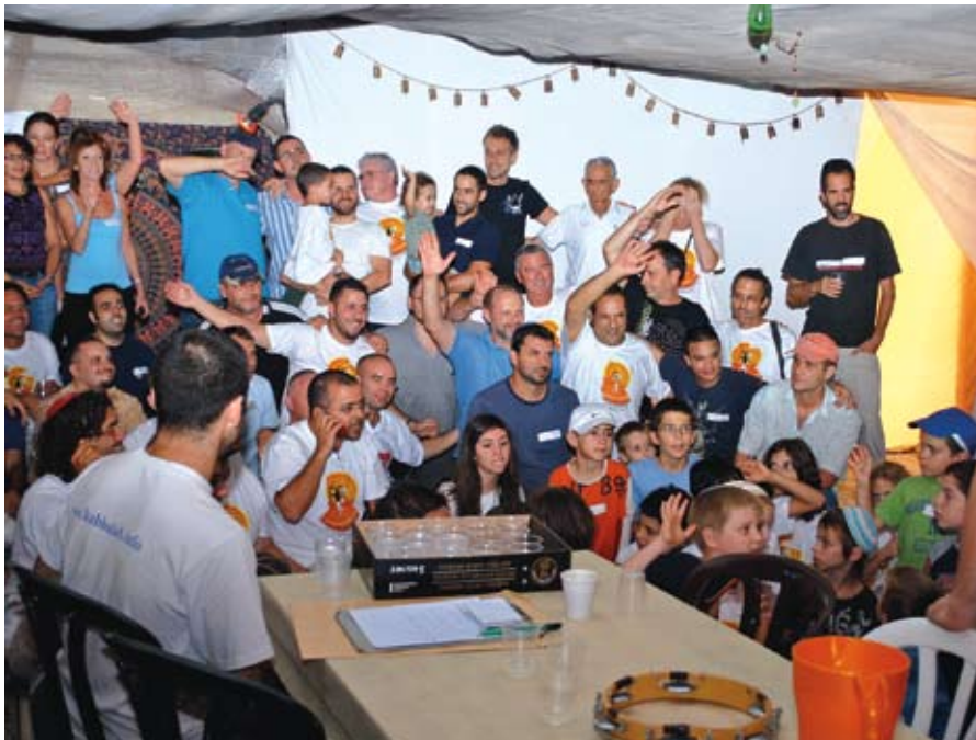
"כאילו אנו מכירים מאז ומתמיד". משתתפי הכנס בגמלייה.

קבוצת "בני ברוך" אילת והערבה קיימת כבר למעלה מחמש שנים. מרכזה הולך ומתבסס בימים אלה באילת וחברים בה אנשים יקרים המפוזרים לכל אורכו של כביש הערבה, עד