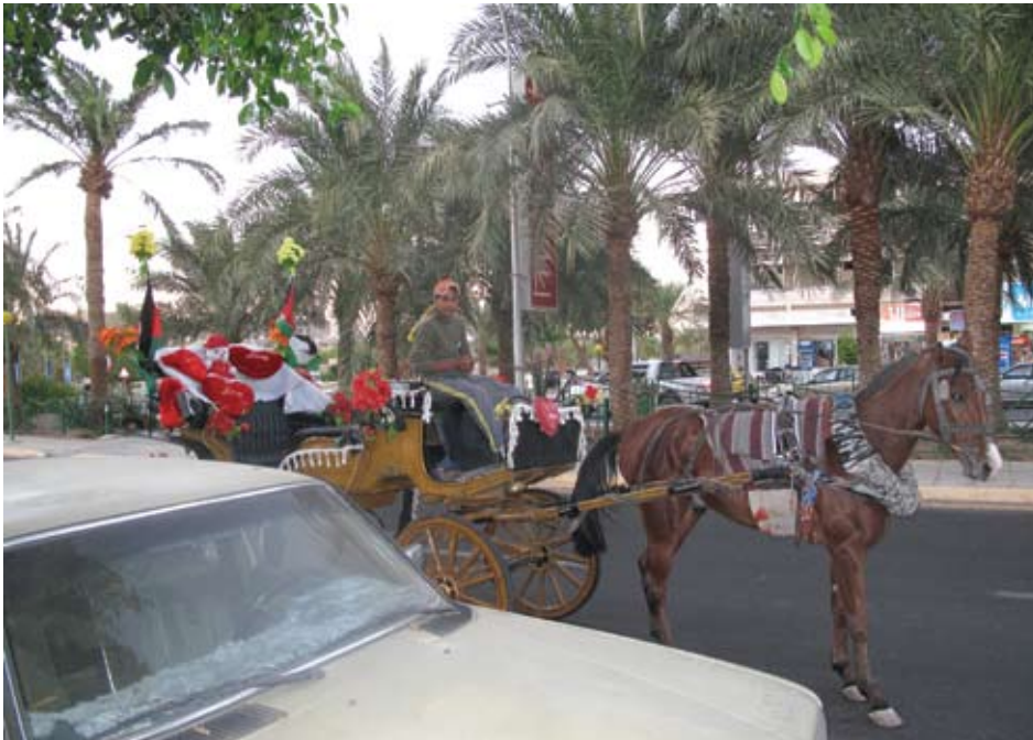
כרכרות באזור התיירות - עדיין נלחמות על כל תייר שעובר: 'welcome' welcome