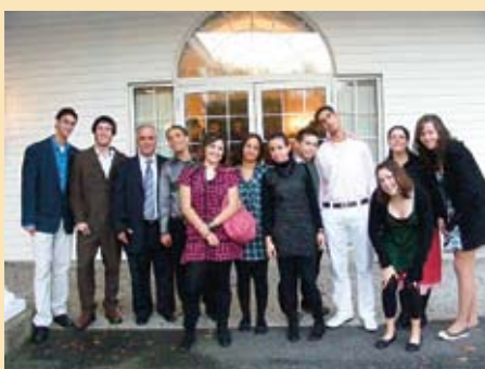
עכשיו כולם ביחד. חברי המשלחת והמלווים

סאפה: "העניין בנסיעה הוא לא ארה"ב, אלא להיות עם אנשים שיכולים להבין אותנו וגם שנהיה ביחד רחוקים מפוליטיקה וחוקים. אני מאמינה שמה שעשה את המרחק בין ערבים ליהודים הוא החוקים: אין שואה בינינו - כי